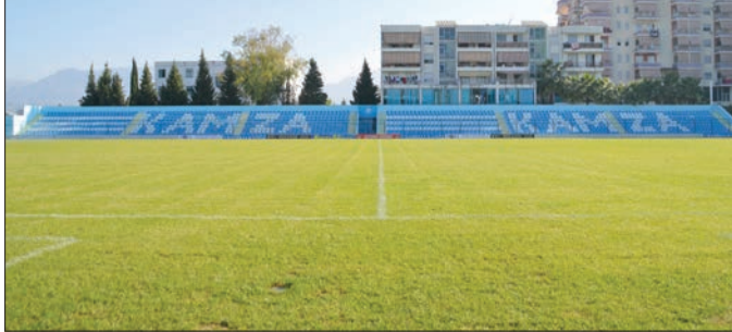
► Fusha e Kamzës